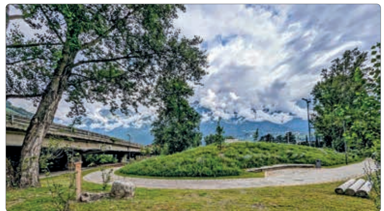
Der neu angelegte Flusspark