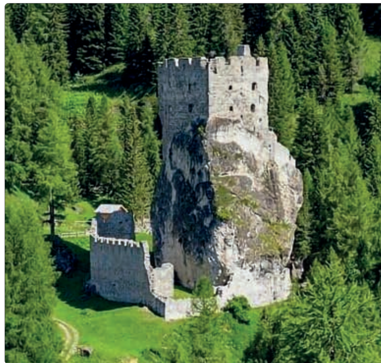
Burgruine Andraz Fluchtbur von kardinal Nicolaus Cusanus 1457/58