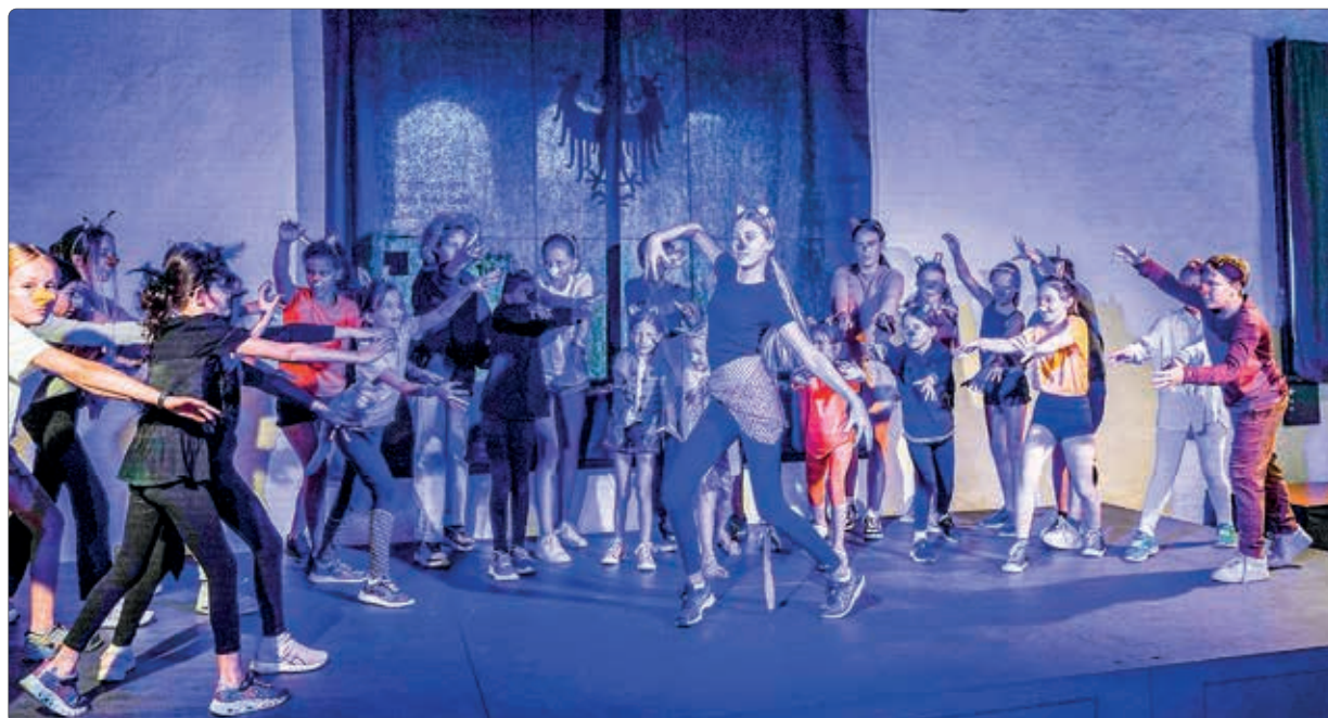
Abschlussaufführung von YOUNG CASTLE 2023 im Rittersaal von Schloss Tirol

Abschluss-Präsentation: Sonntag, 4. August im Rittersaal von Schloss Tirol