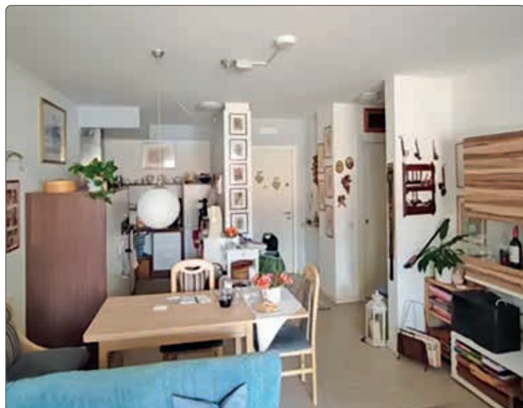
Eine der mit dem neuen Sensor ausgestatteten Wohnungen im Haus Wolkenstein. Das Gerät wurde an der Decke installiert.

Haus Wolkenstein in der Totistraße 22/A verfügt über 37 Seniorenwohnungen. Im Rahmen eines Pilotprojektes wurden diese mit Sensoren ausgestattet, welche im Falle eines Sturzes der Bewohner oder in anderen Notsituationen Abhilfe schaffen und die Rettungskräfte verständigen.