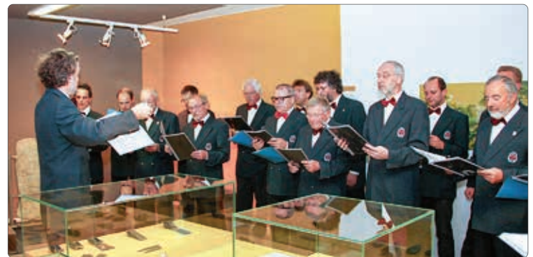
Der Männergesangsverein Meran anlässlich der Ausstellungseröffnung 150 Jahre MGV am 9. November 2012

Singen scheint sogar einen günstigen Einfluss auf die Lebenserwartung zu haben. In einer schwedischen Untersuchung mit über 12 000 Menschen aller Altersgruppen wurde tatsächlich festgestellt, dass Mitglieder von Chören und Gesangsgruppen eine signifikant höhere Lebenserwartung haben als Menschen, die nicht singen. Ob Singen tatsächlich lebensverlängernd wirkt, lässt sich nach derzeitiger Datenlage nicht eindeutig belegen. Einig ist man sich aber über vielfältige positive Wirkungen des Singens. Dabei spielt sicher eine Rolle, dass wer viel singt, unabhängig ob als Profi oder Laie, meist aktiv auf seine Gesundheit achten muss. Sänger wissen, dass zu viel Alkohol, fettes Essen und zu wenig Schlaf der Stimme schaden. Man schützt sich vor Erkältungen und stärkt das eigene Immunsystem. Man achtet auf eine gute Mundpflege. Wichtig ist die richtige Atemtechnik. Sänger betreiben unbewusst effiziente Gesundheitsvorsorge.